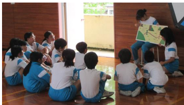
【図書・掲示委員会の読み聞かせ】

毎月10日を「あったかはとっ子の日」とし、各委員会が発表を行うミニ集会や縦割り班での遊び、自然と触れ合う活動を通して、学校の温かい雰囲気づくりに取り組んでいます。集会「本に親しもう」では、図書・掲示委員会がおすすめの本の紹介や読み聞かせを行い、本に関する興味・関心を高めました。集会「あたたかい学校をつくろう」では、あたたかい学校をつくるために大切なことを縦割り班で話し合いました。また、毎回の交流ゲームでは、全校のみんなで仲良く盛り上がり、楽しんでいます。