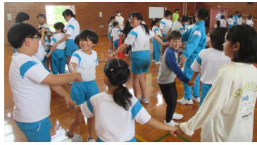
【交流ゲーム「人間知恵の輪」】