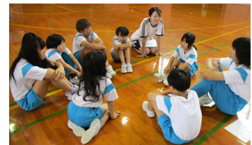
【縦割りグループでの話し合い】